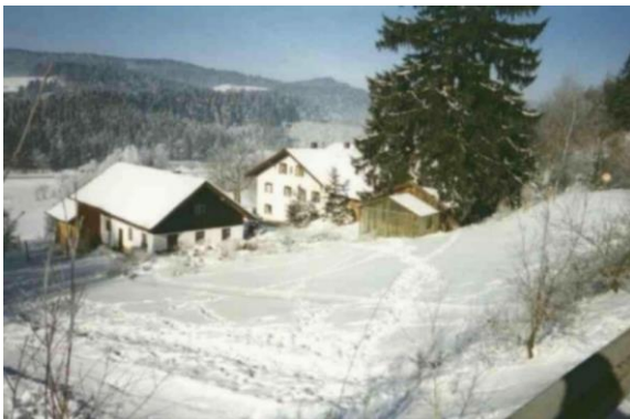
Der Simmerlhof im Winter